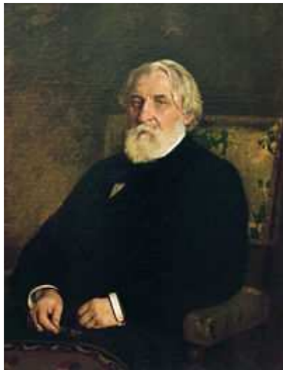
Retrato de Turgénev, obra de Iliá Repin (1879)

En la década de 1840 y principios de 1850 , durante el reinado del zar Nicolás , el clima político de Rusia era agobiante para muchos