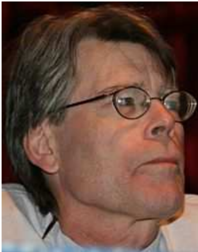
Stephen King en la Comic-Con de Nueva York (2007).